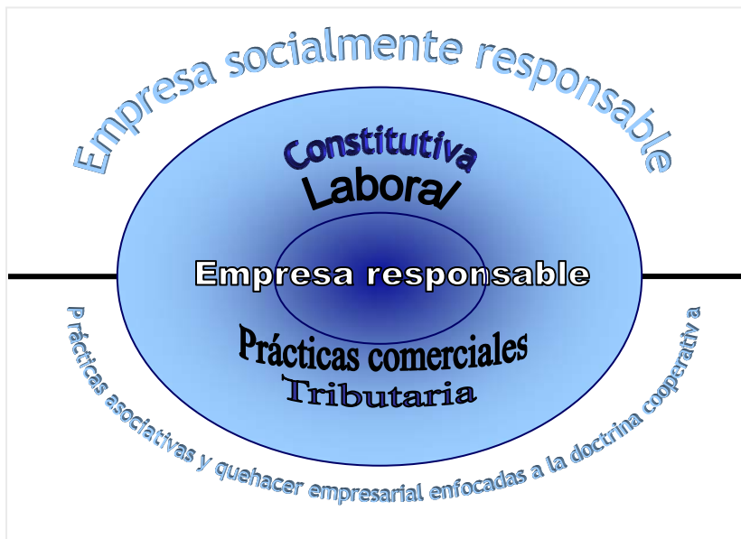
Gráfico 2. De la empresa responsable a la empresa socialmente responsable